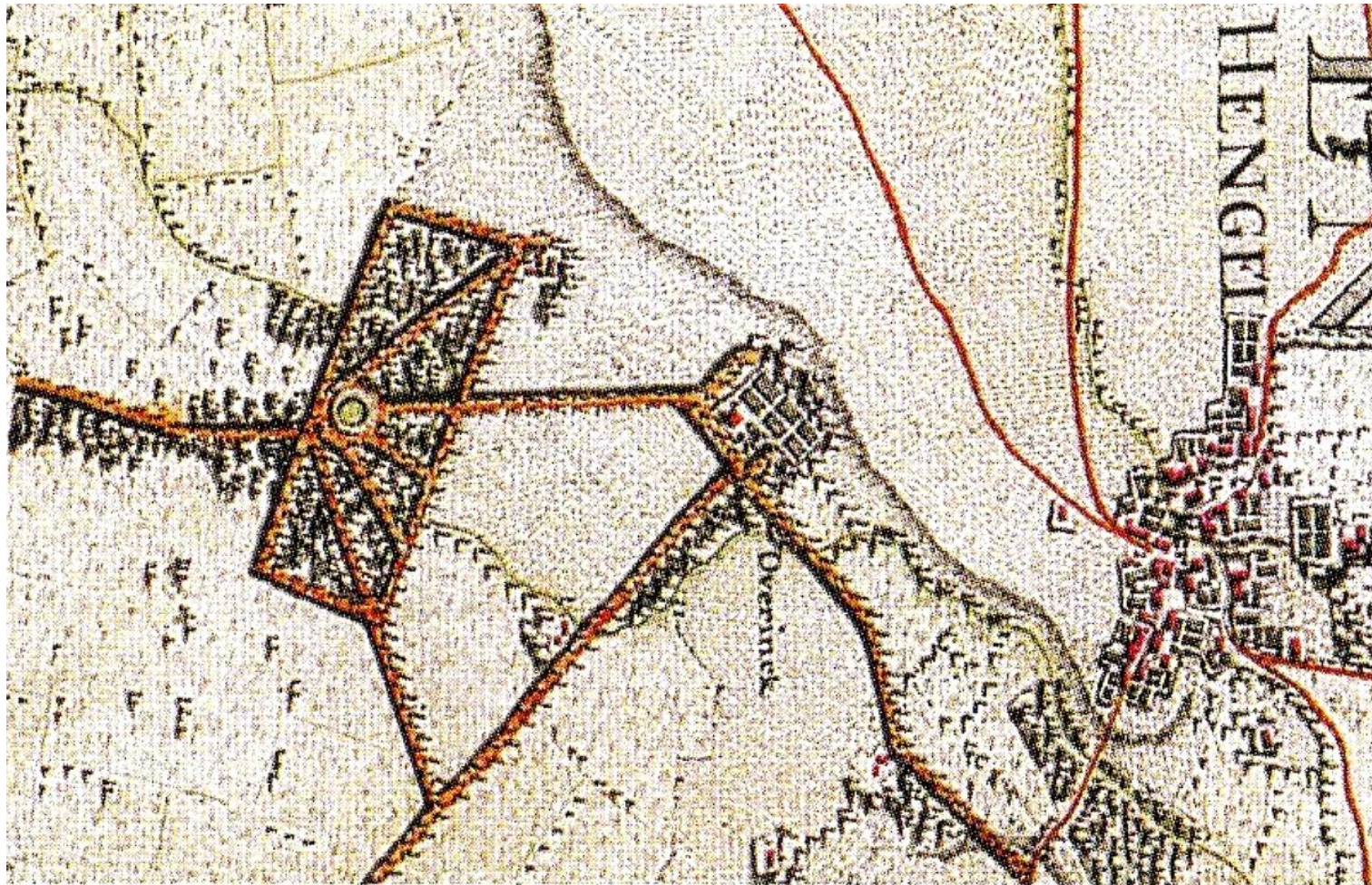
1773-1787 Uitsnede kaart Hottinger Atlas van landhuis Averenk en de 'tuin van vermaak' links, met de vijver in het midden.