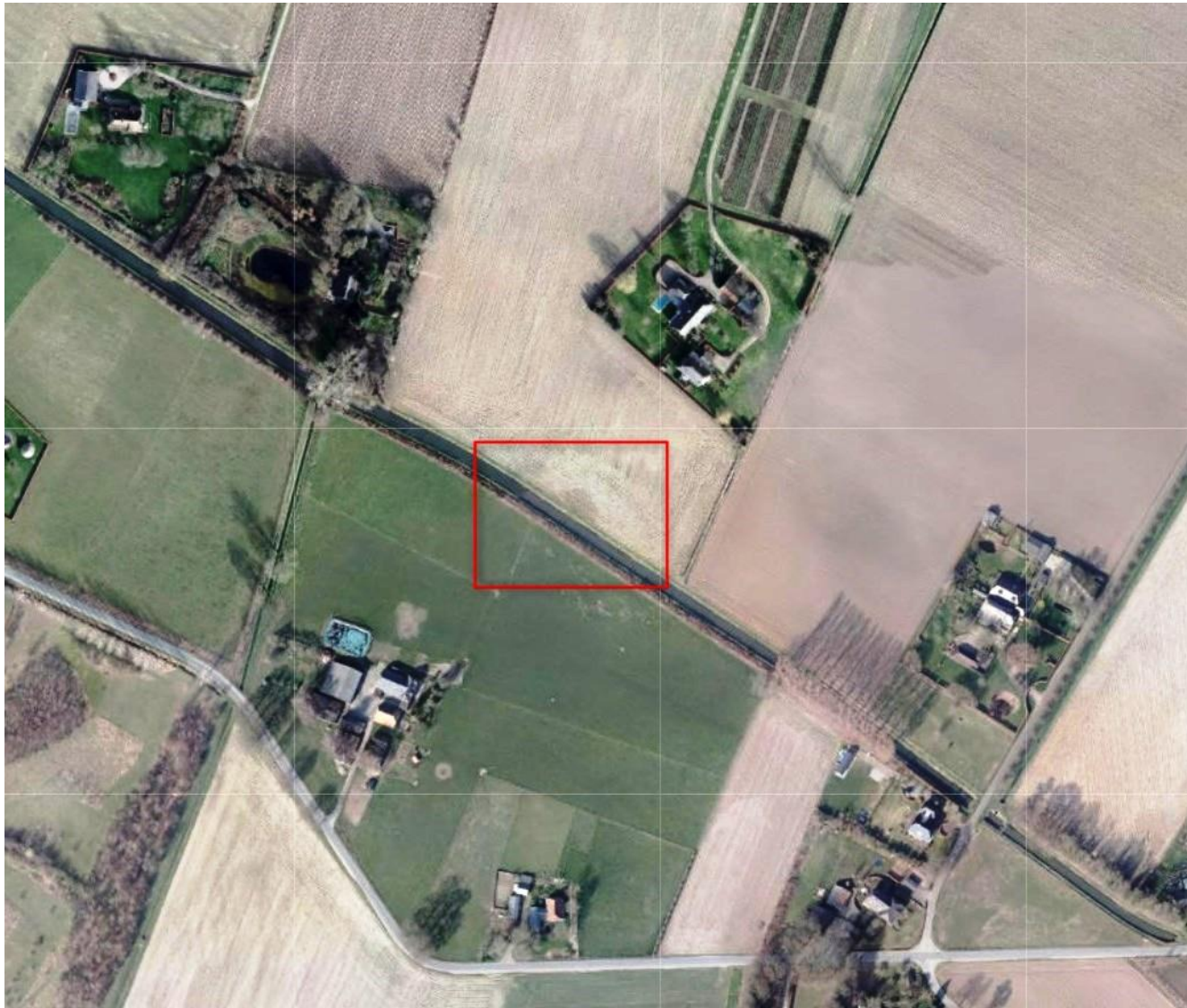
Foto uit 2015 waarop nog steeds de restanten van de vijver, in de vorm van nattere aarde, te zien zijn.

Zie ook: https://oudhengelo.nl/index.php/component/k2/item/155-bruinderinkweg-7-landhuis-averenk-adres-en-bewoning