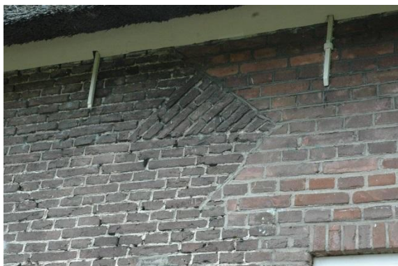
Foto krukhuus waar het oude vlechtwerk nog doorloopt in de voorgevel 'Klein Schuilenberg' Olst

Gelet op dit alles kan ik niet anders concluderen dan dat men op de verpondingskaart deze boerderij belangrijker heeft aangegeven en niet overeenkomende met de werkelijkheid. Of men heeft tussen 1711 en 1921 het voorhuis terug gebracht naar een krukhuismodel, maar waarom zou je dit doen!