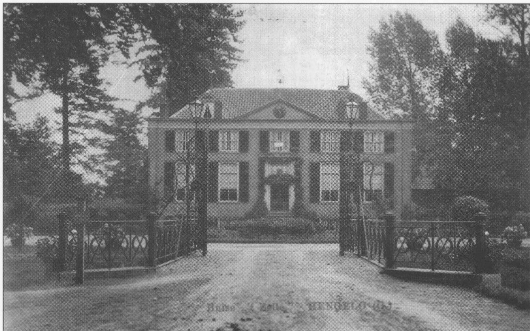
Oude ansicht van huis 't Zelle.

Van Dorth bleef dus kinderloos, en de gezondheid van mevrouw zou nooit meer echt herstellen.