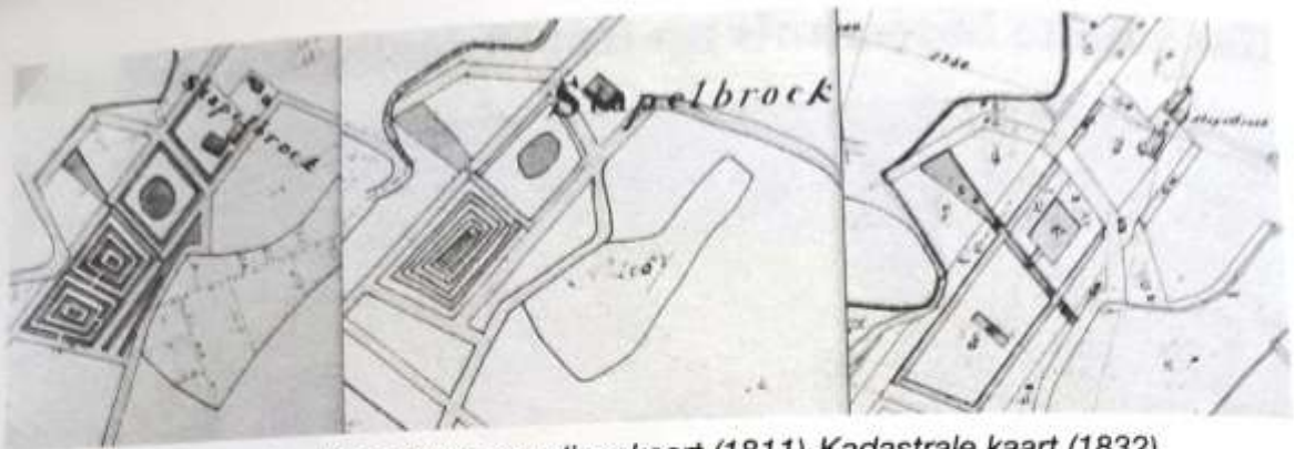
Kaart uit het Maatboek (1810)-Verpondingskaart (1811)-Kadastrale kaart (1832).

nieuwe plek ook weer een landhuis moet zijn verrezen! Doch de precieze plek ervan bleef onduidelijk totdat onderstaande kadastrale hulpkaartjes werden gevonden en waarop te zien is waar dit 170 m 2 grote herenhuis precies heeft gestaan*.